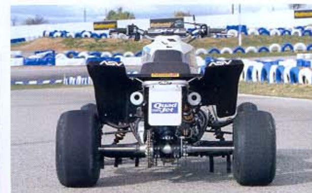
MAYOR ANCHURA. Los cambios en sus trenes rodantes aumentan la anchura del conjunto, algo que aumenta su estabilidad.