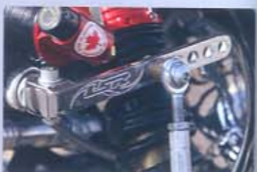
TAMBIÉN REGULABLES. Las estabilizadoras poseen cuatro posiciones de regulación. Con ellas se consigue que el tren delantero se mantenga pegado al suelo en fuertes apoyos en curva.