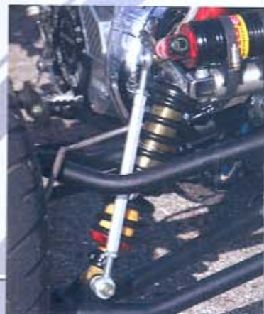
ELKA SUPERMOTO, TRAPECIOS Y ESTABILIZADORA LONESTAR. La anchura aumenta unos centímetros, lo suficiente para disponer de mayor apoyo en todo tipo de curvas.

Pero ahora ya estamos en 2007 y la tendencia a este tipo de preparaciones está generando cada vez más adeptos. Las carreras que se están preparando para este año demuestran que esta especialidad por fin se está tomando en cuenta en