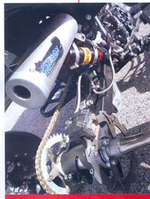
EL BASCULANTE LONESTAR es uno de los elementos que también está pintado al horno. El tren trasero se complementa con un amortiguador ELKA, el eje TEAM ULTIMATE y el doble escape FAT BOY.