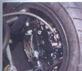
POTENCIA DE FREMADA. Para detener la gran potencia de su motor, las excelentes pinzas de doble pistón Nissin juegan un papel muy importante.