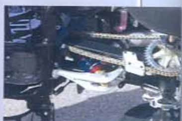
BIELETA DE SERIE. Es uno de los pocos elementos que se han mantenido de serie además del chasis.