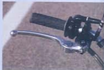
PUÑO DE GAS MOTION PRO Y MANETA DE FRENO REGULABLE. El cambio del gatillo por un puño es muy común en cualquier preparación.