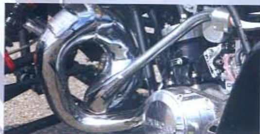
AUTÉNTICA OBRA DE ARTE. Los escapes Paul Turner ofrecen un rendimiento excelente además de un sonido orquestal.