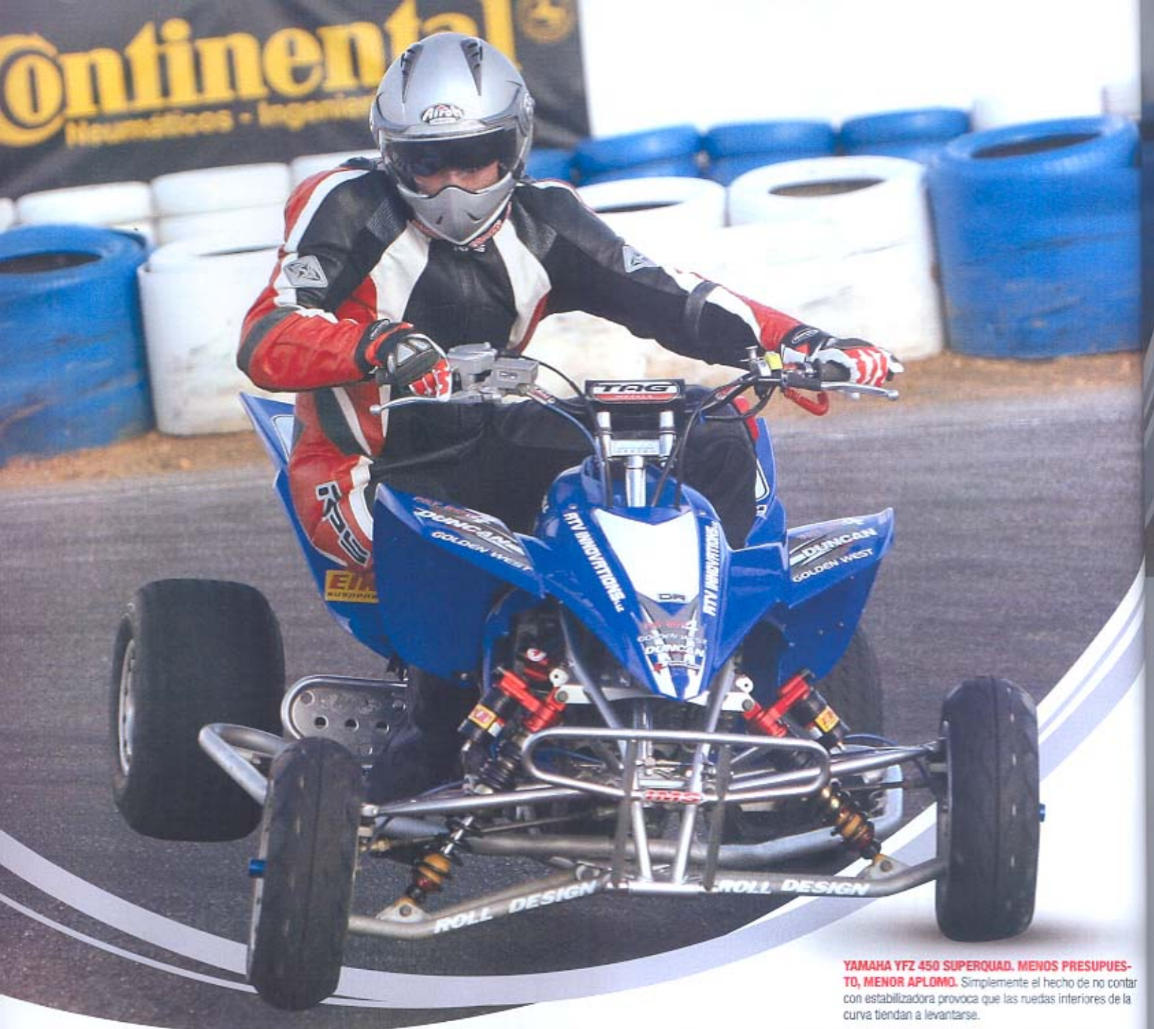
YAMAHA YFZ 450 SUPERQUAD. MENOS PRESUPUESTO, MENOR APLOMO. Simplemente el hecho de no contar con estabilizadora provoca que las ruedas interiores de la curva tiendan a levantarse.