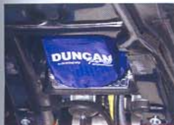
MEJOR RESPIRACIÓN. El kit de admisión permite mayor entrada de aire al motor, que necesita respirar mejor dadas sus grandes prestaciones.