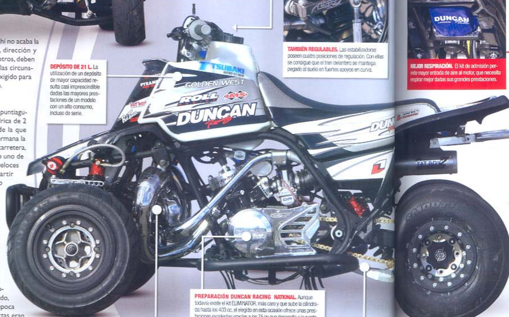
PREPARACIÓN DUNCAN RACING NATIONAL. Aunque todavía existe el kit ELIMINATOR, más caro y que sube la cilindrada hasta los 403 cc., el elegido en esta ocasión ofrece unas prestaciones excelentes gracias a los 75 cv que desarrolla a la rueda.